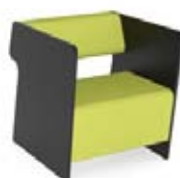
Magnes II 111

DIMENSIONS EXTÉRIEURES EXTERNAL DIMENSIONS 67 x 81 cm