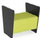
Magnes II 110

DIMENSIONS EXTÉRIEURES EXTERNAL DIMENSIONS 67 x 56 cm