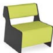
Magnes II 101

DIMENSIONS EXTÉRIEURES EXTERNAL DIMENSIONS 67 x 76 cm