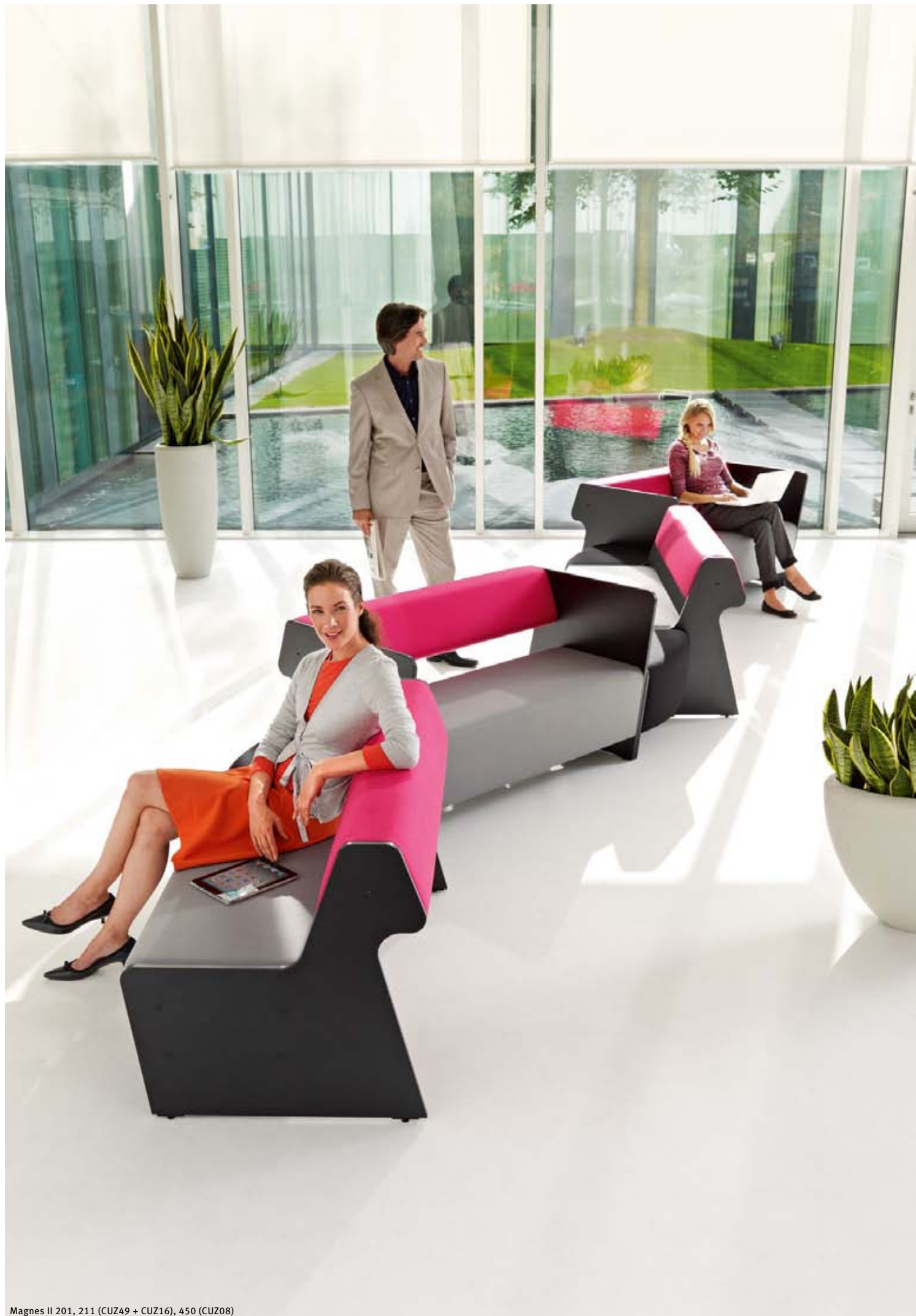
Magnes II 201, 211 (CUZ49 + CUZ16), 450 (CUZ08)