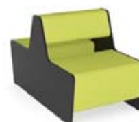
Magnes II 501

DIMENSIONS EXTÉRIEURES EXTERNAL DIMENSIONS 67 x 126 cm