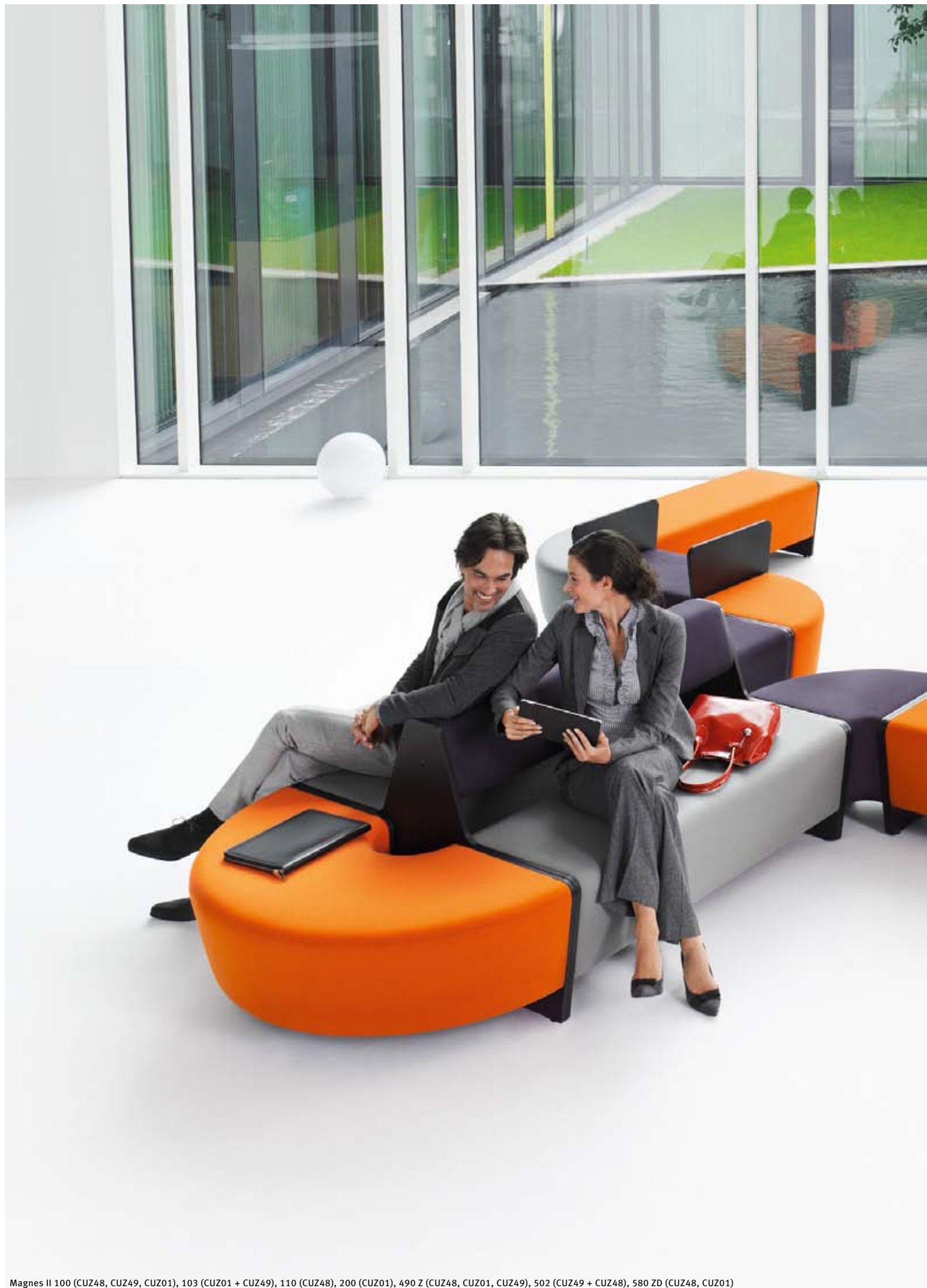
Magnes II 100 (CUZ48, CUZ49, CUZ01), 103 (CUZ01 + CUZ49), 110 (CUZ48), 200 (CUZ01), 490 Z (CUZ48, CUZ01, CUZ49), 502 (CUZ49 + CUZ48), 580 ZD (CUZ48, CUZ01)